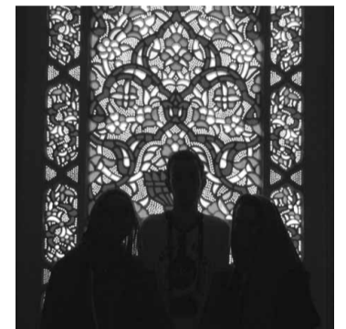
Mesquita de Kharamanmaras

A viagem à Turquia foi uma experiência inesquecível. É um país maravilhoso, com alguns hábitos diferentes dos de Portugal. Foi um choque cultural muito positivo, com cheiros e vistas novas e diferentes a cada passo, desde os bazares às mesquitas, passando pelas especiarias e chá. Uma gastronomia fenomenal! Mas o melhor desta viagem foi, sem dúvida, o espírito de grupo sentido por todos os envolvidos. Formaram-se amizades inquebráveis entre estudantes de várias nacionalidades. Ficou a promessa do reencontro. ♦