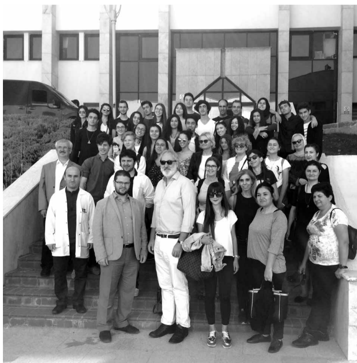
Grupo na universidade de Kharamanmaras